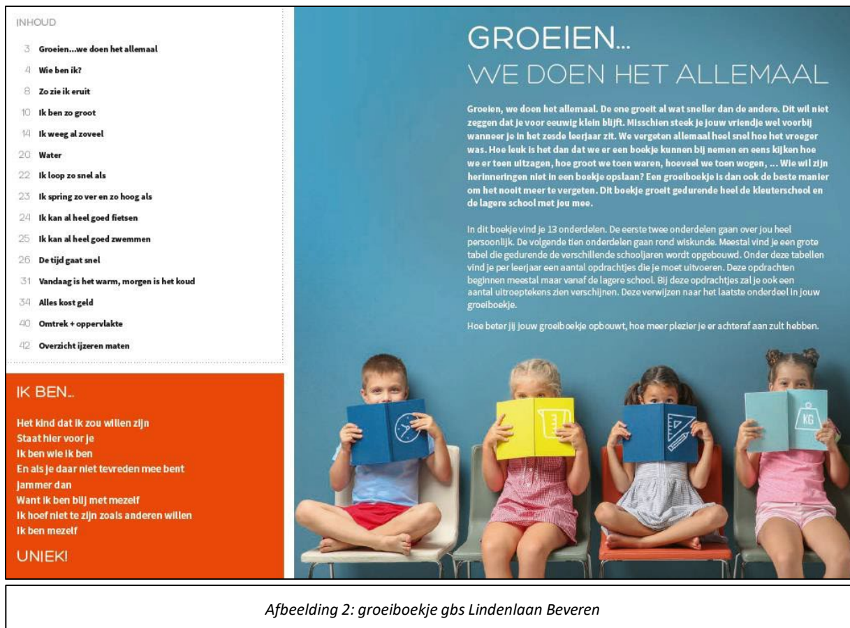
Afbeelding 2: groeiboekje gbs Lindenlaan Beveren